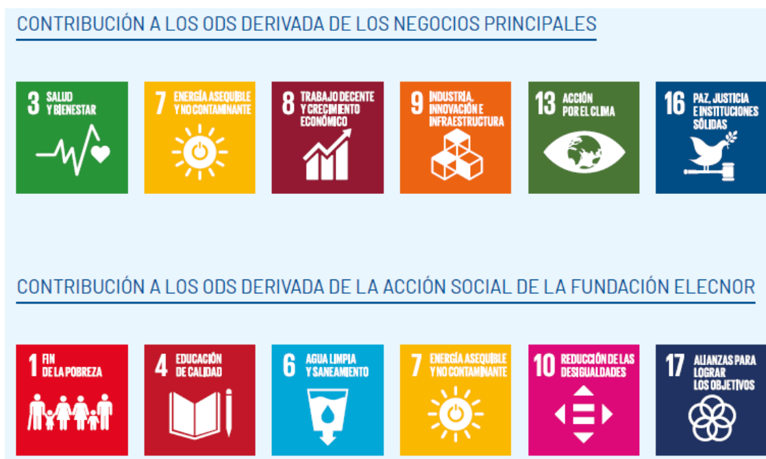
Figura 3.3. Contribución de Elecnor y de la Fundación Elecnor con los ODS.

A continuación, se presenta la relación principal de Elecnor y la Fundación Elecnor con los ODS: