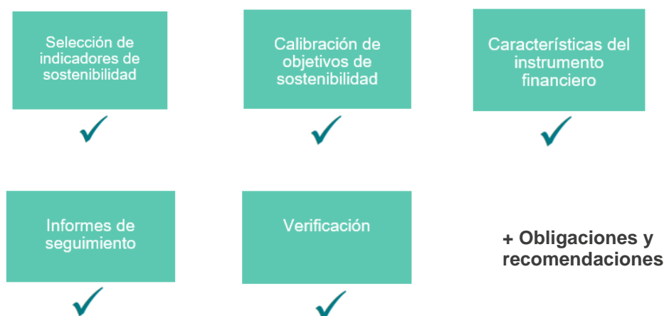
Figura 5.1. Calificación global del Programa 2024-2025.

La calificación anterior implica las siguientes obligaciones: